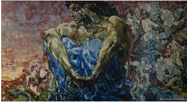
1. M.Vrubel. "Demon". 1890.

Görkəmli rəssam M.Vrubel mifoloji poetik, rəmzi mənalı devrilmiş Demon (Şeytan) əsərini yaradarkən obrazın (şəkil 1) diqqət çəkən xüsusiyyətləri meydana çıxır. Bekə ki, əsərdə personaj Qafqaz dağlarının üstündə yerdə oturmuş. Demonun fiqurunu təsvir etmişdir. Kompozisiyada böyük varlığın daxili hisləri ilə yanaşı, onun zaman və məkan üzərində olan hakimliyini rənglər və forma cəhətdən göstərə bilmişdi.