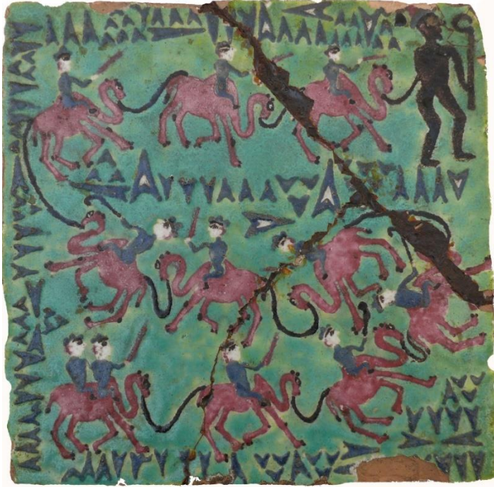
Şəkil 3. XVI-XVII əsrlərə aid “Avesta” motivli kaşı nümunəsi

bağlı ola bilər. Ehtimal olunur ki, bu təsvir Zərdüştün icma tərəfindən qəbul edilmədiyi dövrdə keçdiyi uzun və çətin yolun simvolik ifadəsidir.