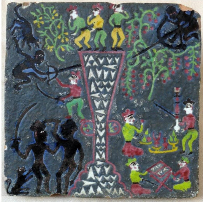
Şəkil 4. XVI-XVII əsrlərə aid “Avesta” motivli kaşı nümunəsi

Sütunun özü V-şəkilli ağ rəngli ornamentlərlə bəzədilmişdir ki, bu da kompozisiyada dekorativ elementlərin ümumi ahəngdarlığını artırır. Kompozisiyanın sol yuxarı küncündə bir it təsvir olunmuşdur. Onun bir qədər aşağı hissəsində isə əlində qılınc tutan insanla döyüşən cin obrazı bədii görüntüyə gətirilib. Kompozisiyanın aşağı hissəsində isə iki cin bir-biri ilə vuruşur; onlardan birinin əlində xəncər, digərində isə qısa nizə və qılınc vardır. Kompozisiyanın sağ alt küncündə də daha bir it təsvir edilmişdir.