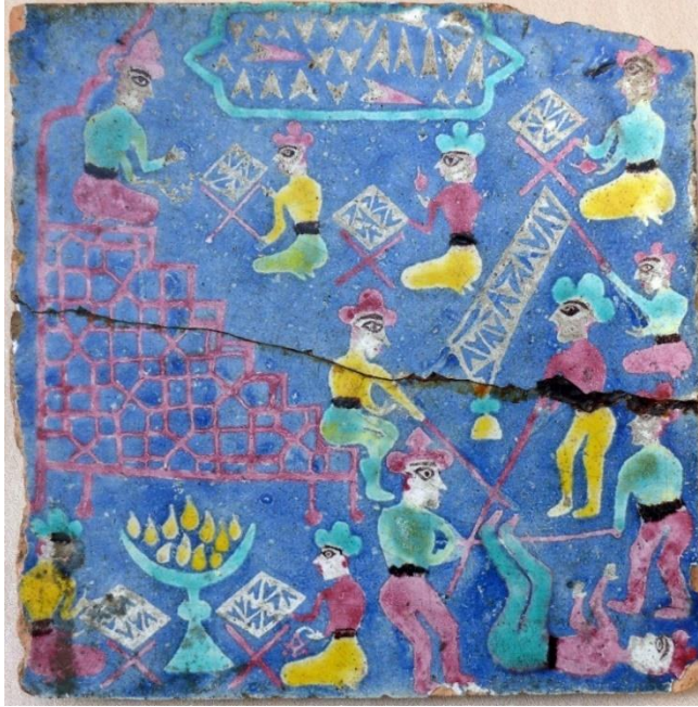
Şəkil 2. XVI-XVII əsrlərə aid “Avesta” motivli süjetlə xas kaşı nümunəsi

məstədicə təsirə malik bitkinin budağı) tutmuşlar. Bu detallar dini ayinlərin və Zərdüştilik inancının rituallarının əks olunduğunu göstərir.