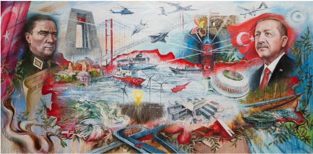
Ülkər Əbülfət. “Türkiyə Cümhuriyyətinin yüz illiyi”. 2023.

Atatürk və Türkiyə Respublikasının indiki prezidenti Rəcəb Tayyib Ərdoğanın bədii obrazları təşkil edir. Tablodə hər iki görkəmli türk siyasi liderinin dövründə Türkiyənin ictimai-siyasi və mədəni həyatında baş verən bir çox yeniliklər, o cümlədən Türkiyənin daxili və xarici siyasətinin bədii təzahürü öz əksini tapmışdır.