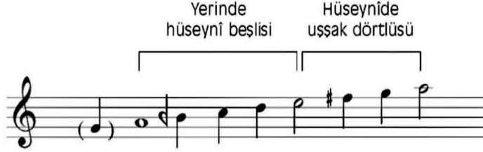
Şəkil 4. Hüseyni səs qatarı Hüseyni məqamının şifrələməsi aşağıdakı kimidir: (Y) K S T T K S T

kimi səsləndirilir. Hüseyni dizini (səs qatarını), təsvirlərini ümumi şəkildə ümumiləşdirsək, Hüseyni dizisi yerində Hüseyni beşlisinə, Hüseyni pərdəsinə Uşşaq dördlüsünün əlavə edilməsi ilə əmələ gəlir.