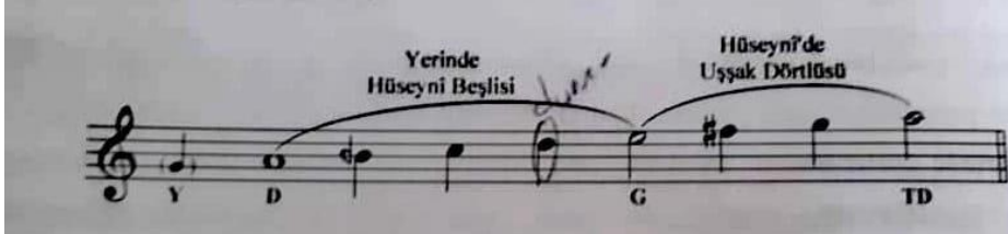
Şəkil 5. Hüseyni səs qatarında Y-D-G-TD (Şəkil, Ferit BULUT; “Makamsal Dikte ve solfejler” kitabından alınıb)

Tədqiqatçı Ferit Bulut “Makamsal Dikte ve solfejler” kitabında Hüseyni məqamı dizisini bu şəkildə göstərmişdir. (Şəkil 5-də yer alan Y: yeden səsi, D: durak pərdəsinə, G: güclüsünü, TD: tiz durak pərdəsinə ifadə etməkdədir) [3; 50-60].