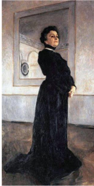
4. V.Serov. “Aktrisa M.Yermolovanın portreti”. 1905.

“Muğam”, “Musiqiçilər” adlı əsərini muğam sənətimizin təbliği, sənətkarın muğam sənətinin alt qatlarında gizlənən fəlsəfi mahiyyətinə dərinlən bələdliyini bir daha duymuş oluruq. Kompozisiyada musiqiçilərin ifa zamanı müxtəlif pozalarda yerləşdirilməsi, xüsusi ilə xanəndənin keçirdiyi hissləri, tərki dünyalığının verilməsi, tablonun ekspressiv dinamikliyi tamaşaçını sanki muğam musiqisinin ecazkar ritmi altında kökləmiş olur. Dahi Rus rəssamı V.Serov isə tamamilə fərqli quruluş seçmişdir. Bu fərqliliyi onun görkəmli rus aktrisası M. Yermolovanın portretində (şəkil 4) görmək olar. Rəssam nöqtəyi-nəzərdən portretin kompozisiyası üçün şaquli quruluş seçməsi təsadüfi olmamışdır. Məhz bu baxımdan uzun illər ərzində öz sənətkarlığı ilə tamaşaçıların diqqətini portretdə aktrisanın obrazının möhtəşəm yadda qalan baxım almasını şərtləndirmişdir.