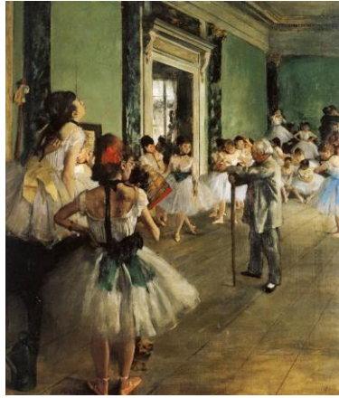
5. E.Deqa. “Balet məktəbində”. 1874.

Monumentalılıq prinsipi rəngakarlıq əsərlərində ən aparıcı sahələrdən birini özündə əks etdirir. Bu xüsusiyyətləri biz təsvir obyektində əsasən kiçik detalardan imtina etməklənlə əldə etmiş oluruq. Bu tərzə özündə əks etdirən sənət əsərləri monumental əsərlər sırasına aid edilir. Rəssam təsviri sənətdə əsasən seçdiyi süjet xətti mənalı və formaya görə düzgün təsvir obyektini özündə əks etdirməlidir. Bu prinsiplər sənət əsərlərində əsas amillərdən birini özündə əks etdirir. Demək sənət əsrlərinin süjeti xətti ən vacib məqamlardan birini daşıyır. Rəssam əsasən təsvir obyektinə çevirdiyi fiqurların və əşyaların ön planda təsvirini göstərməklənlə əsərlərə monumental və təsürat xarakterli zövqü danılmazdır. Rəssam həyatda baş verən hadisələri və ya təsadüf nəticəsində rast gəldiyi səhnələr kompozisiyanın daha mənalı alındığının şahidi oluruq. Bu tərzə özündə əks etdirən kompozisiyalar adətən real həyatda çox sürətlənlə dəyişən anlardan birini əks etdirmiş olur.