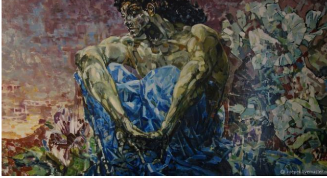
1. M.Vrubel. "Demon". 1890.

Azerbaijan State University of Culture and Arts, XXXXIII edition, Baku, 2023