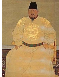
Şəkil 2. Rəngarəng Çin geyimləri

Bu dövrlərdə monqolların ən böyük bayramı olan “Cama” (cejda) bayramı keçirilirdi. Bu bayramda insanlar üç gün ərzində hər gün müxtəlif rəngli geyimlər geyinirdilər. Bu zaman geyimlə bərabər həm onun rəngi, həm də naxış–bəzəyi diqqətə alınır.