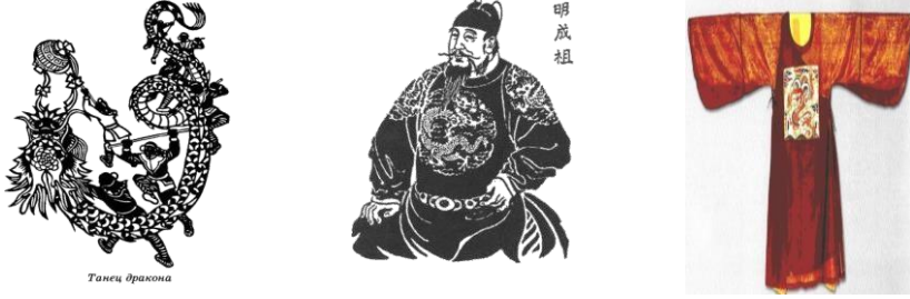
Şəkil 3. Çin tekstil sənətində əjdaha təsvirləri

olmayan dinamiklik verilmişdir. Əslində Elxanilərin Təxti–Süleyman sarayındakı bəzəkli lövhələrinde olan əjdahaları daha çox Mərkəzi Asiyanındır. Nəinki Çinli Yuan Çinin dövrünün (1280–1367–ci illərdə) Çində hökmranlıq etmiş monqol sülaləsi heyvan təsvirlərindən olan əjdaha və tovuz quşları Çin tarixinin digər dövründəki heyvan obrazlarından daha təcavüzkardır. Bu qədim simvolların yeni interpretasiyası – Mərkəzi Asiya təsirinin nəticəsidir. (şəkil 3)