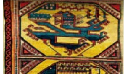
Şəkil 5. Xalça. “Əjdaha ilə simurqun döyüşü” Yun. Xovlu. 172x90. XV əsr. Qazax qrupu. Azərbaycan. Berlinin İncəsənət Muzeyində saxlanılır

Əgər onun Koreya və Şərqi Asiya təsiri kifayət dərəcədə tədqiq edilməsinə baxmayaraq Orta Şərq incəsənətinə olan təsirinin tədqiqi aparılmayıb, hər yerdə