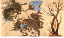
Şəkil 4. Abr

da səkkizguşəli lövhələr üzərində olan simurqlar və ikibaşlı, beş caynaqlı əjdaha təsvirləri ilə zəngin idi.